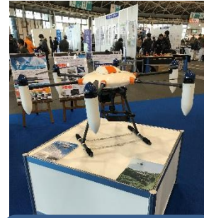
自動車に関するイベントですがUAV「Winser」も注目を集めていました。