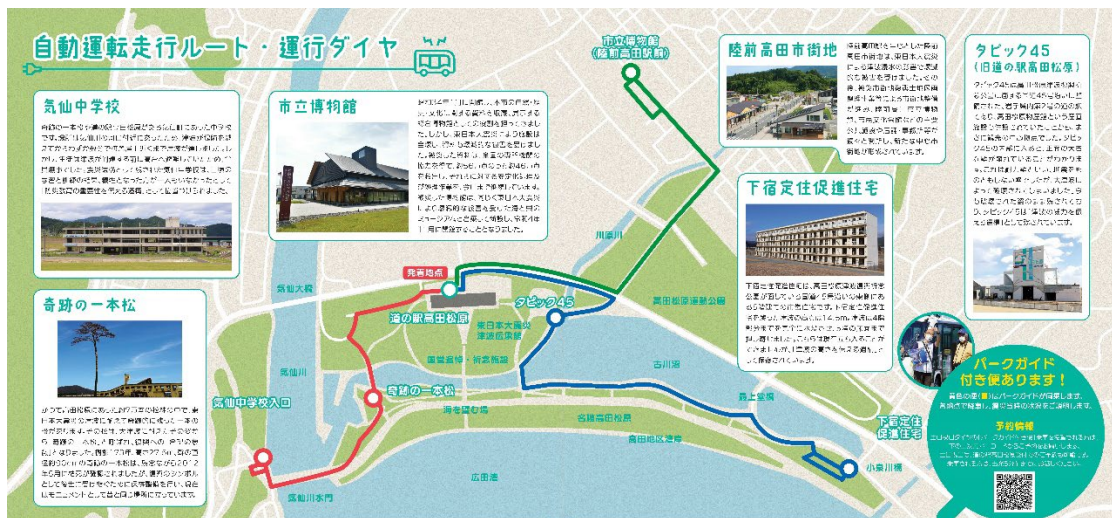
< 自動運転走行ルート >

本運行は、2023年2月から3月に実施(注)した自動運転走行実証実験のルートに加え、「陸前高田市街地」までルートを拡大し走行します。土日祝日はパークガイドが車両に同乗する便も運行し、点在する東日本大震災に関連する施設を紹介します。従来までの「祈念公園内での観光サービスとしての実装」に加え、「祈念公園内で実証した技術の活用先としてのまちなかでの実装」を行い、両面から今後の課題抽出と受容性の調査を行います。