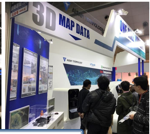
自動運転式小型EV「Milee（マイリー）」には多くのご質問を頂戴しました。