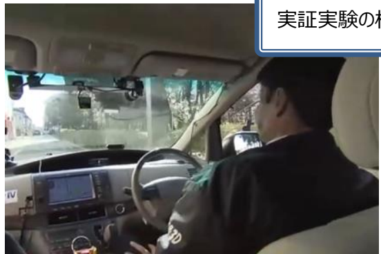
実証実験の様子です