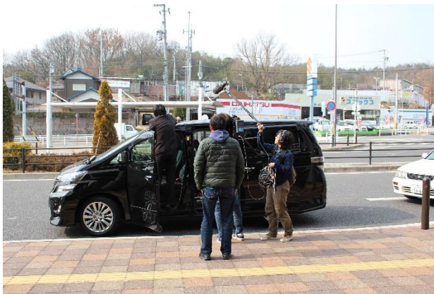
車線認識用機材の取り付け