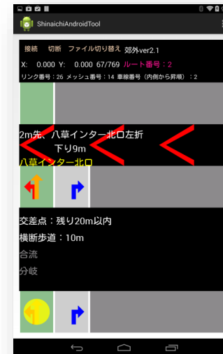
「車線認識」中の画像等