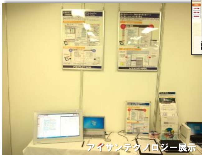
アイサンテクノロジー展示