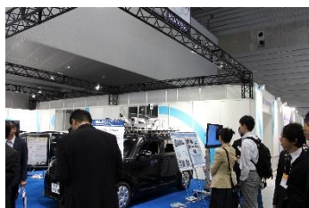
企画展示コーナー（当社）