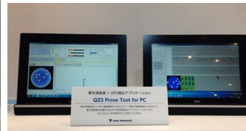
【準天頂衛星に係るソフトウェア製品】