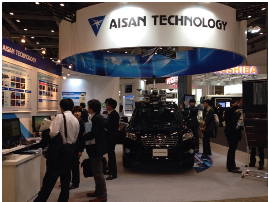
【当社展示ブース全体】

本面談を通して、複数の商談機会も得る中、今後のMMSを中心とした事業展開に大きな期待が持てる1日となりました。